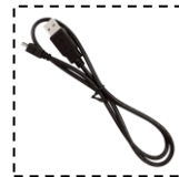
Micro USB 數據線